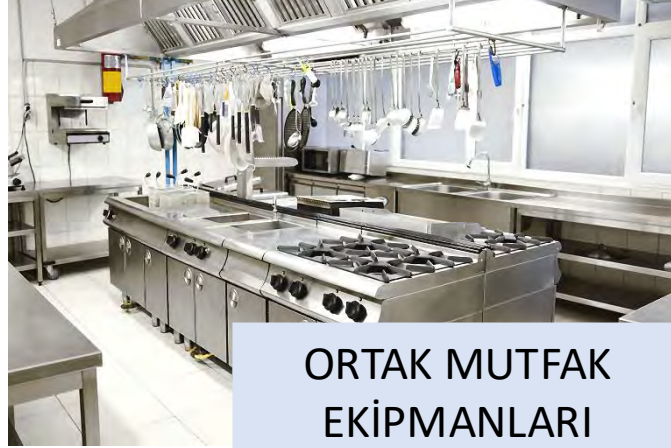
ORTAK MUTFAK EKİPMANLARI