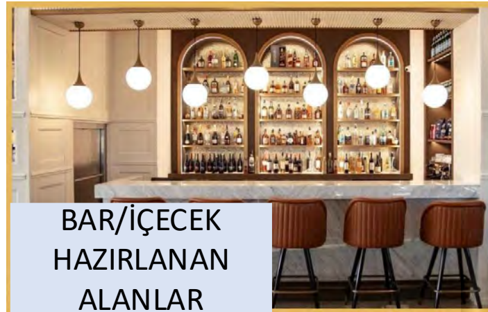
BAR/İÇECEK HAZIRLANAN ALANLAR