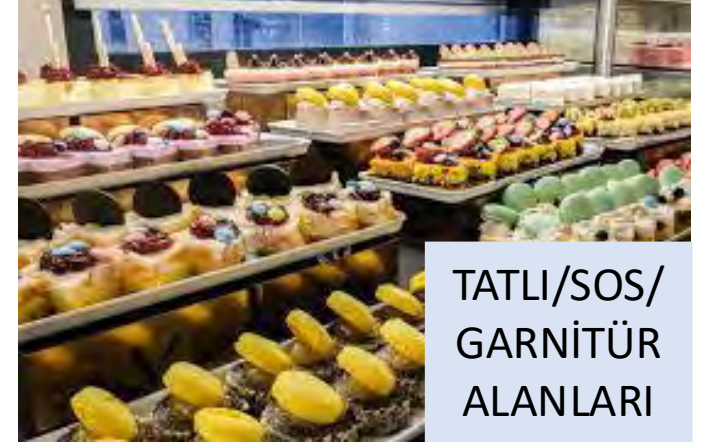
TATLI/SOS/ GARNİTÜR ALANLARI